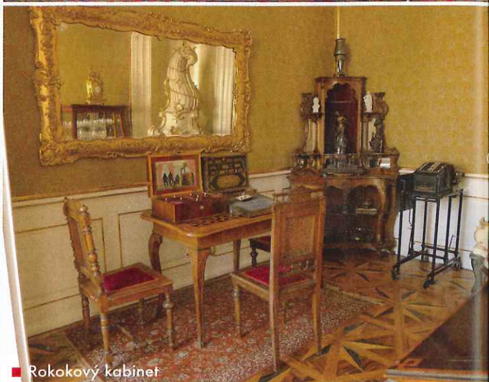
■ Rokokový kabinet

rakouský trůn. Také je tu umístěna mramorová busta císaře Františka I. v odění římských císařů. Právě v tomto sále se měli setkat před slavkovskou bitvou rakouský císař František II. a ruský car Alexandr I. Tady se konala porada o strategii bitvy s císařem Napoleonem.