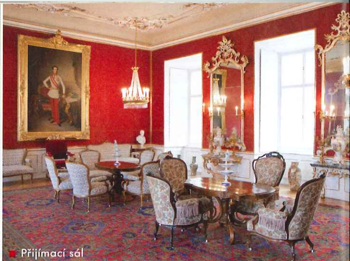
■ Příjímací sál