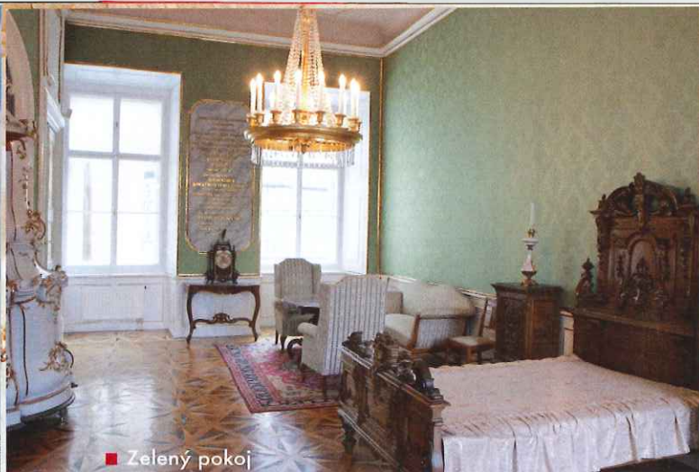
■ Zelený pokoj