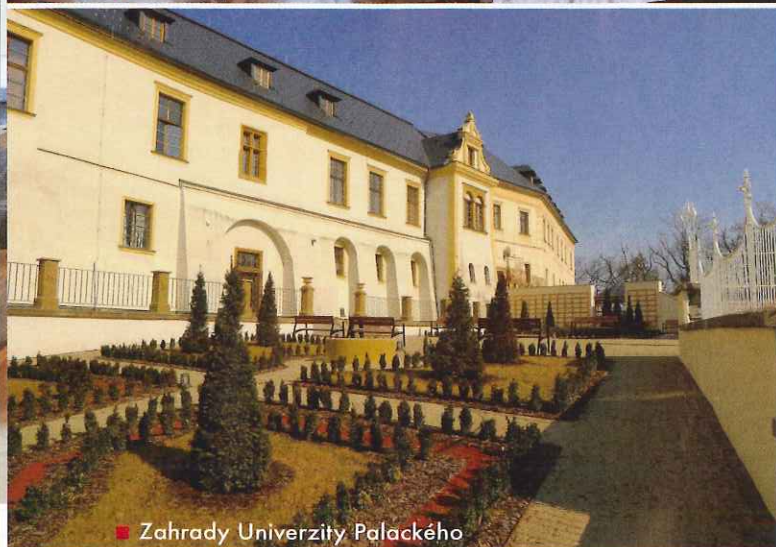
■ Zahrady Univerzity Palackého